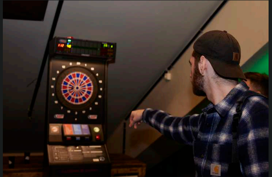
Beispiele Module #1 und #2