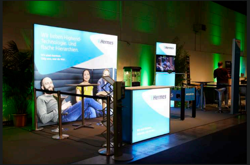
Beispiele Aussteller-Flächen #1-3