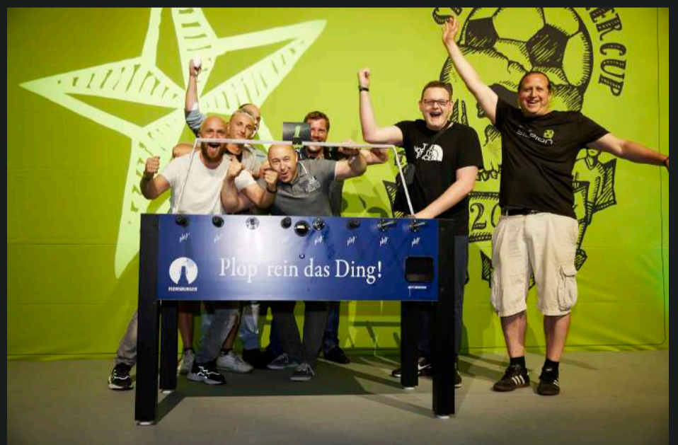
Beispiele Logo-Platzierung #5 und #6