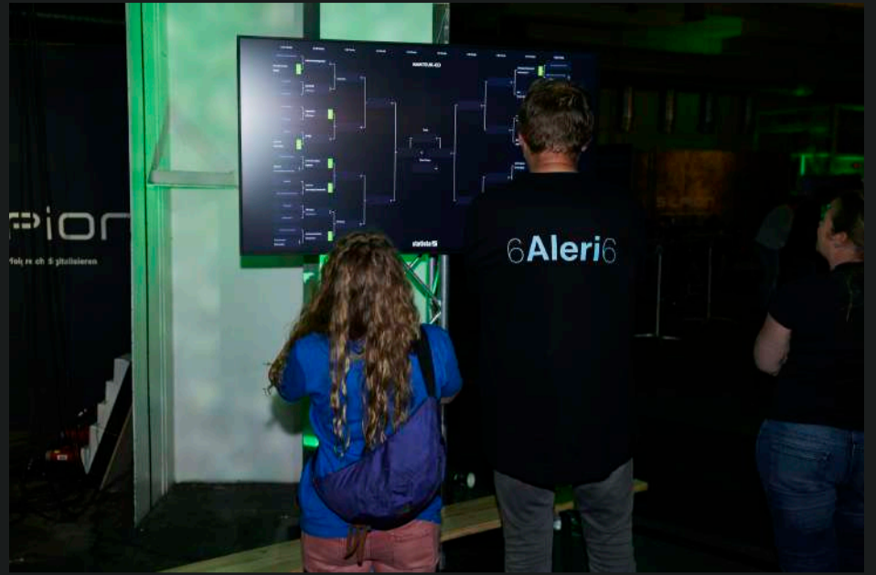
Beispiele Logo-Platzierung #2 und #3