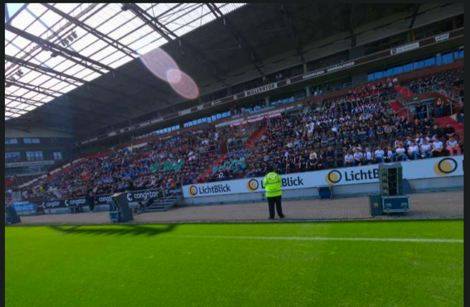
Beispiele Logo-Platzierung #4 und Startschuss-Ambiente (Haupttribüne)