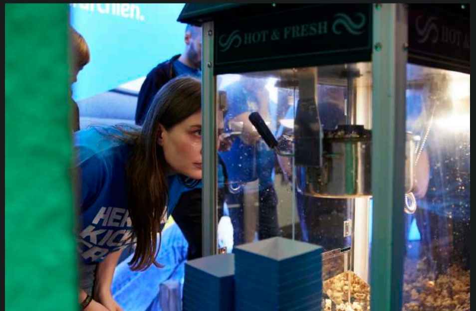
Beispiele Module #4 und #6